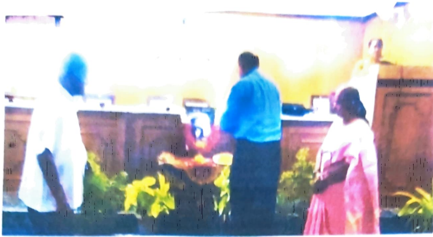
ಭಾವ ಚಿತ್ರಕ್ಕೆ ಸೂಜೆ